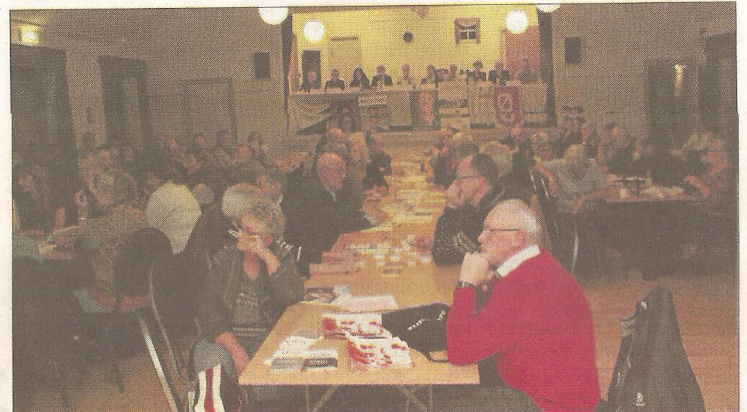
Noget rabaldermøde blev det aldrig - dertil var deltagerne ganske pludseligt alt for enige. Små vindmøller er gode, de store er noget skidt, og de bedste står på havet. Konsensus-Danmark i sving, og der er valgkamp.